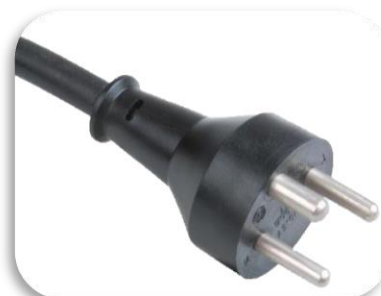
DK (Tip K)