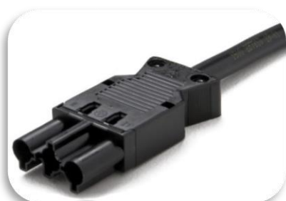
EPN 3M0 (EPN 1104, Wieland)