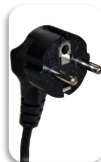
FR (Tip E – CEE 7/7 utičnica)