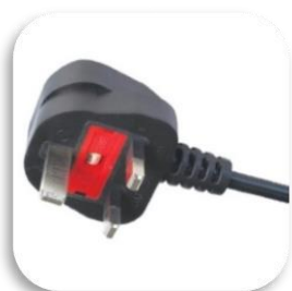
UK (Tip G)