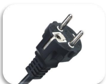
Schuko (Tip F – CEE 7/4 utičnica)