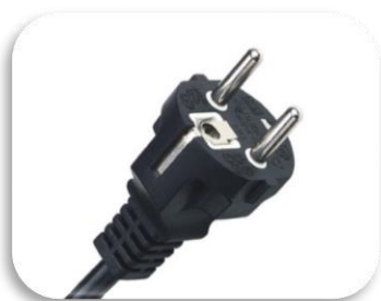
Schuko (Tip F – CEE 7/4 utičnica)